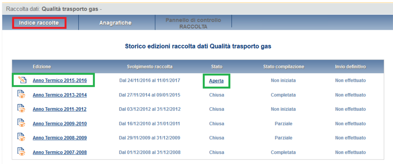
Figura 1.3: Storico della raccolta

Accedendo alla raccolta viene visualizzata la pagina “Pannello di controllo” (figura 1.4), dove è presente un elenco di due voci: “Area Omogenea di Prelievo” e “Punto di ingresso alla rete di trasporto”.