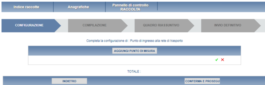
Fig 2.1 B: configurazione Punti di Misura

Nelle figure 2.2 e 2.3 sono rappresentate le configurazioni di “Area Omogenea di Prelievo” (figura 2.2 A e 2.3 A) e “Punti di ingresso alla rete di trasporto” (figura 2.2 B e 2.3 B); come da art. 17, comma 1, lettera a, per ogni AOP i dati da inserire sono: