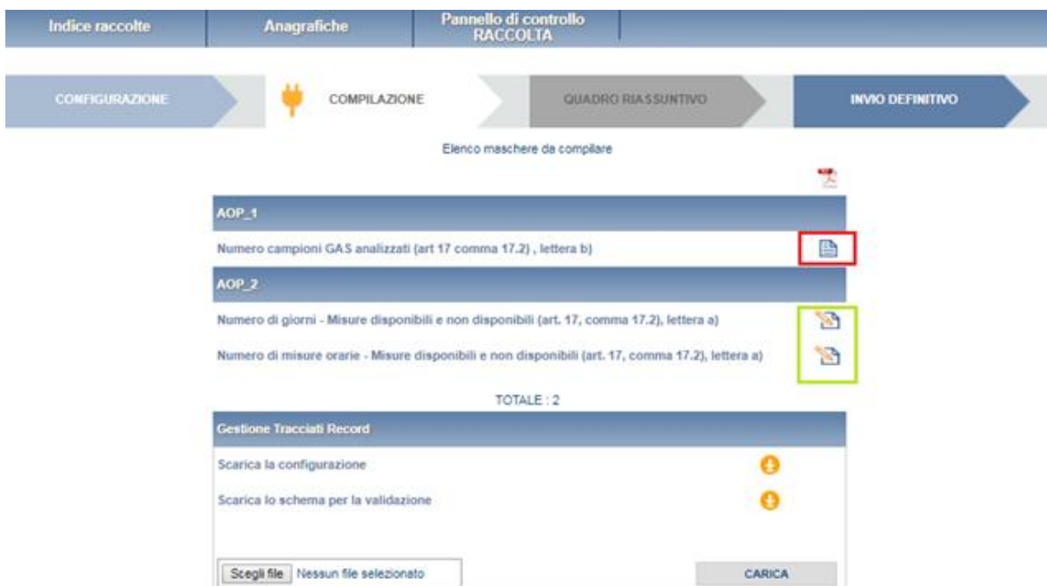
Figura 4.5: Elenco maschere dopo la compilazione

Dopo che una maschera (qualunque essa sia) è stata compilata correttamente, ed è stato effettuato il salvataggio, l'icona associata alla maschera da compilare nella pagina di elenco delle maschere (figura 4.1) cambierà aspetto come evidenziato in figura 4.5 (rettangolo rosso), per permettere all'utente di poter comprendere quali maschere ha già compilato e quali deve ancora compilare (rettangolo verde).