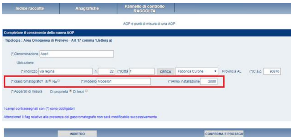
Figura 2.2 A: Configurazione Punti di misura di una AOP

In particolare, nella figura 2.2 è visualizzato il caso in cui venga selezionata l’opzione “Sì” del campo “Gascromatografo” (rettangolo rosso) che porterà l’utente a dover inserire obbligatoriamente anche il “Modello” ed “Anno di installazione”.