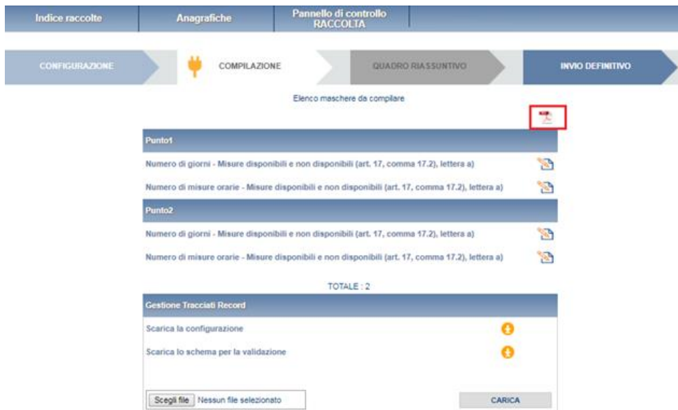
Figura 4.1: Elenco delle maschere da compilare

Di seguito verrà descritta la struttura delle maschere da compilare. In particolare, gli esempi si riferiranno ai “Punti di ingresso alla rete di trasporto” ma, visto che le maschere sono uguali, le indicazioni sono valide anche per “Area Omogenea di Prelievo”.