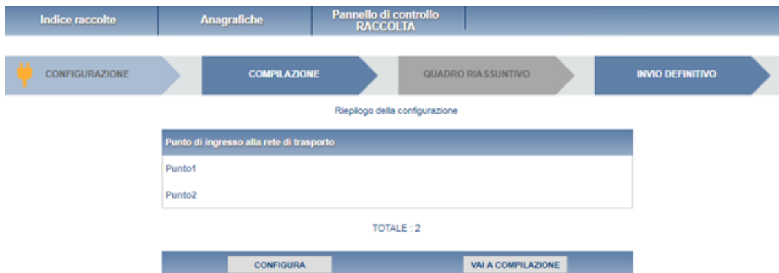
Figura 3.1: Riepilogo della configurazione