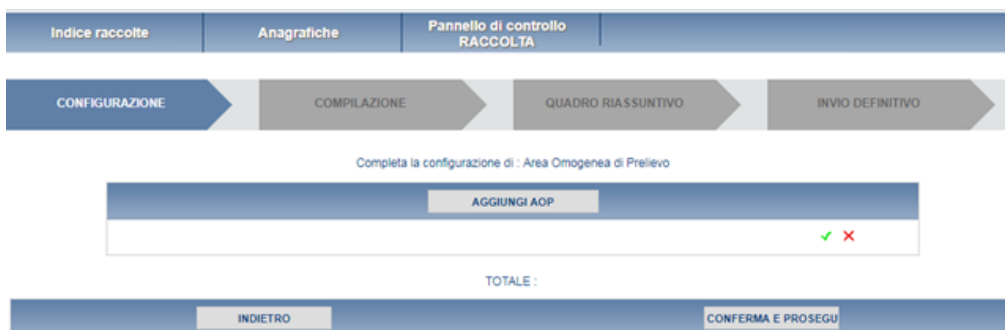
Fig 2.1 A: configurazione Area Omogenea di Prelievo