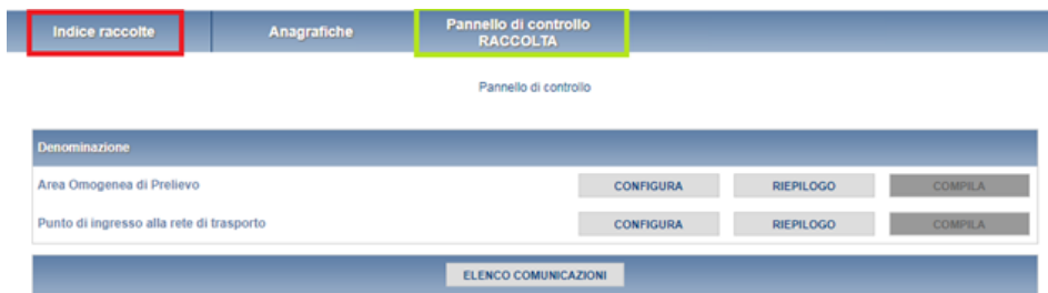
Figura 1.4: Pannello di controllo

Le funzioni di configurazione/compilazione cambieranno colore in base allo stato di configurazione/compilazione. Il tasto di configurazione in un primo momento sarà di un azzurro spento, mentre quando verrà salvata almeno una configurazione, diventerà di un azzurro più acceso. “Compila” è di norma disabilitato; quando verrà effettuata almeno una configurazione verrà reso attivo e sarà di colore azzurro spento; quando sarà salvata almeno una compilazione di una maschera, diventerà azzurro acceso.