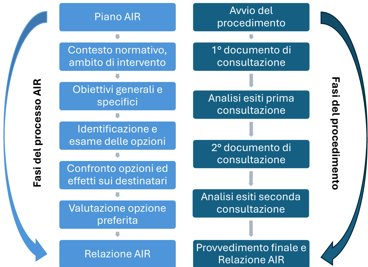
Figura 2: Le fasi del procedimento e del processo AIR

Di seguito si riportano i contenuti pertinenti dei citati documenti: