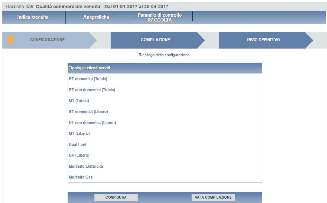
Figura 4.1: riepilogo configurazione

Nella schermata successiva verrà mostrato il riepilogo della configurazione scelta (figura 4.1).