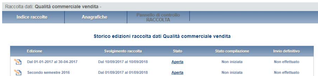
Figura 2.3: storico edizione

Attenzione: con il nuovo sistema non sarà possibile accedere alla raccolta oltre la data di chiusura della stessa.