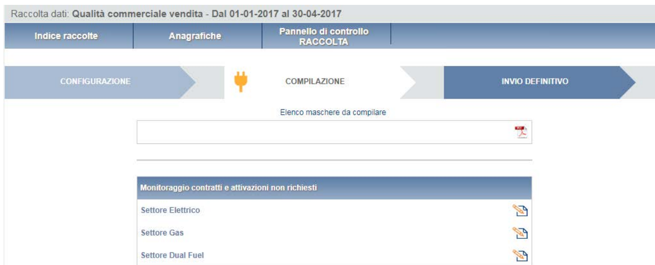
Figura 5.1: elenco maschere da compilare

Solo al termine della compilazione di tutte le maschere è possibile procedere all'INVIO DEFINITIVO.