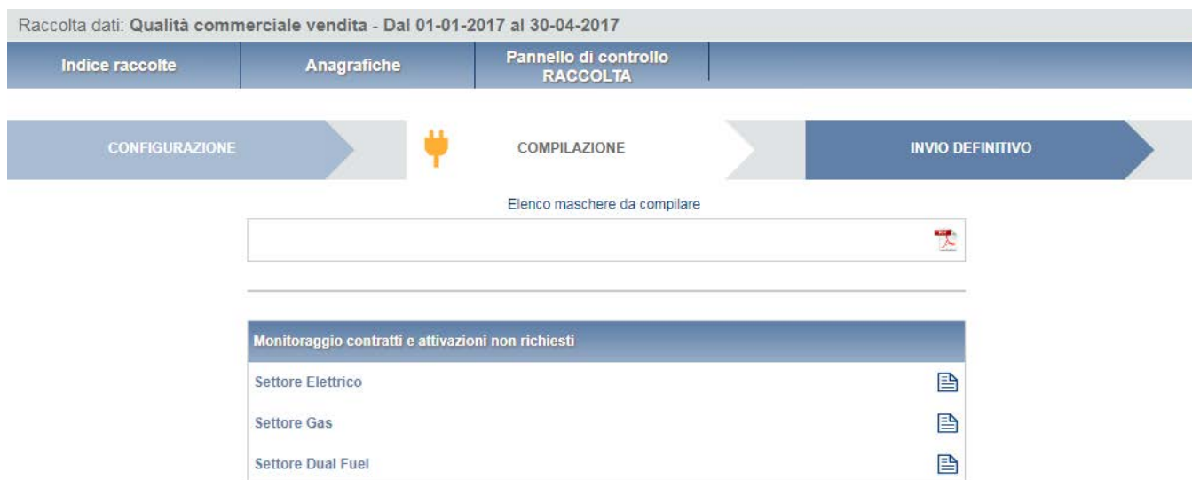
Figura 7.1: stato compilazione e icona PDF