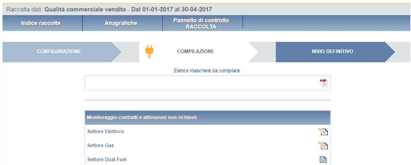
Figura 6.4: maschere da compilare

Si ricorda inoltre, di compilare esclusivamente le maschere relative al settore in cui si è effettivamente svolta l'attività di vendita; se non si è svolta attività di vendita per un settore, ad esempio il settore elettrico, aprire la relativa maschera (che sarà comunque visualizzata) nella pagina con l'elenco delle maschere, e cliccare direttamente sul tasto “SALVA” (figure 6.4 e 6.5).