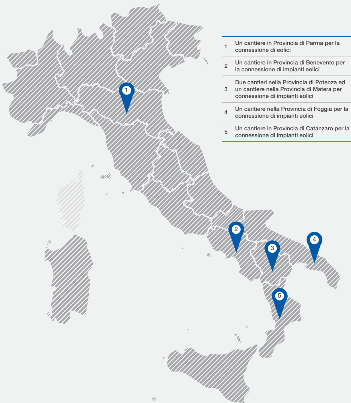
FIGURA 3 Cantieri in corso

La Figura 3, riporta infine, i principali cantieri in corso, per connessione di impianti FER.